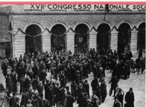
Il Congresso di fondazione del P.C.d'I 21 Gennaio 1921 a Livorno

Organo del Partito Comunista d'Italia Fondato da A. Gramsci il 12 Febbraio 1924