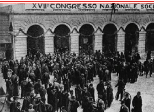
Il Congresso di fondazione del P.C.d'I 21 Gennaio 1921 a Livorno

Organo del Partito Comunista d'Italia Fondato da A. Gramsci il 12 Febbraio 1924