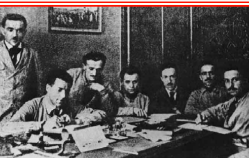
Il Consiglio dei Delegati della FIAT nell'ufficio di Agnelli durante l'occupazione della Fabbrica nel 1920