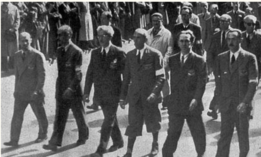
Dal Sito web dell'A.N.P.I. : www.anpi.it

Grazie a Voi, ai Vostri dirigenti ma soprattutto a tutti gli iscritti ed ai militanti per la vostra presenza e per l'insostituibile lavoro democratico svolto per il bene di tutti. ■