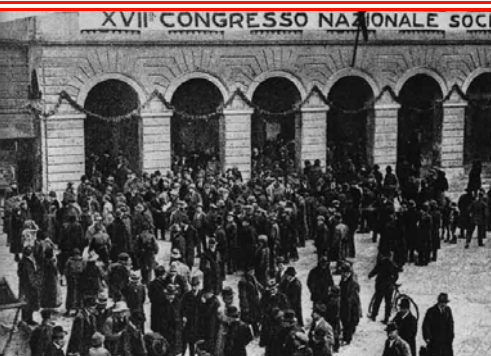
Il Congresso di fondazione del P.C.d'I 21 Gennaio 1921 a Livorno

Organo del Partito Comunista d'Italia Fondato da A. Gramsci il 12 Febbraio 1924