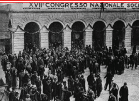
Il Congresso di fondazione del P.C.d'I 21 Gennaio 1921 a Livorno

Organo del Partito Comunista d'Italia Fondato da A. Gramsci il 12 Febbraio 1924