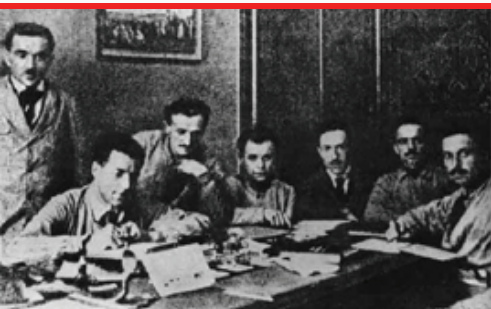
Il Consiglio dei Delegati della FIAT nell'ufficio di Agnelli durante l'occupazione della Fabbrica nel 1920