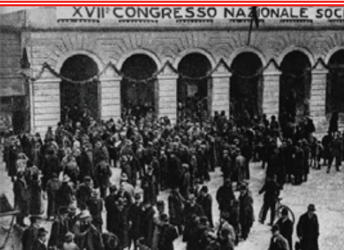
Il Congresso di fondazione del P.C.d'I 21 Gennaio 1921 a Livorno

Organo del Partito Comunista d'Italia Fondato da A. Gramsci il 12 Febbraio 1924